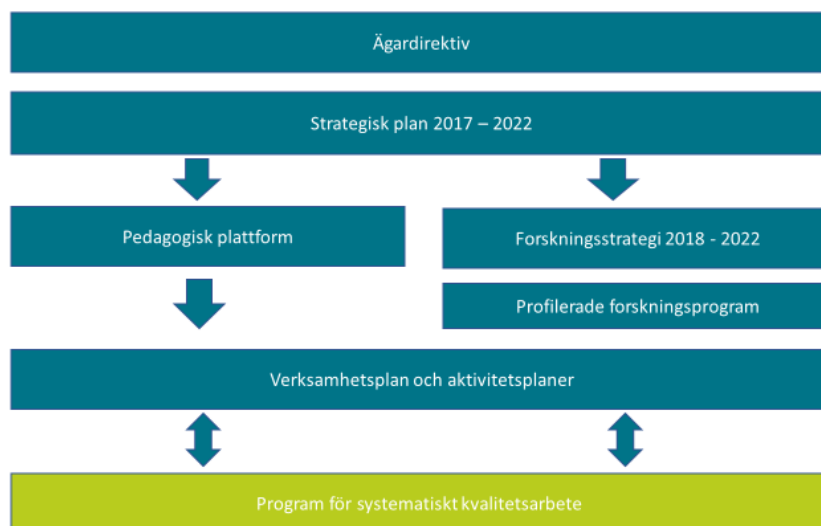
Figur 1: Högskolans styrdokument och dess inbördes relation.

uppföljbara mål och aktiviteter för att nå de övergripande målen i den strategiska planen. Högskolans forskningsstrategi 7 utgör en konkretisering av den strategiska planen inom högskolans forskningsverksamhet. I forskningsstrategin formuleras övergripande mål för högskolans forskningsfrågor som i sin tur konkretiseras i profilerade forskningsprogram samt hur forskningen ska komma utbildningen och samhället till gagn och vice versa. I högskolans pedagogiska plattform 8 formuleras gemensamma utgångspunkter för utvecklingen av det pedagogiska arbetet vid högskolan. I ovanstående interna styrdokument formuleras mål och strategier för högskolans olika verksamheter. Program för systematiskt kvalitetsarbete utgör ett gemensamt ramverk för hur det systematiska kvalitetsarbetet ska bedrivas i högskolan för att uppnå ovannämnda mål och strategier inom högskolans olika verksamhetsområden.